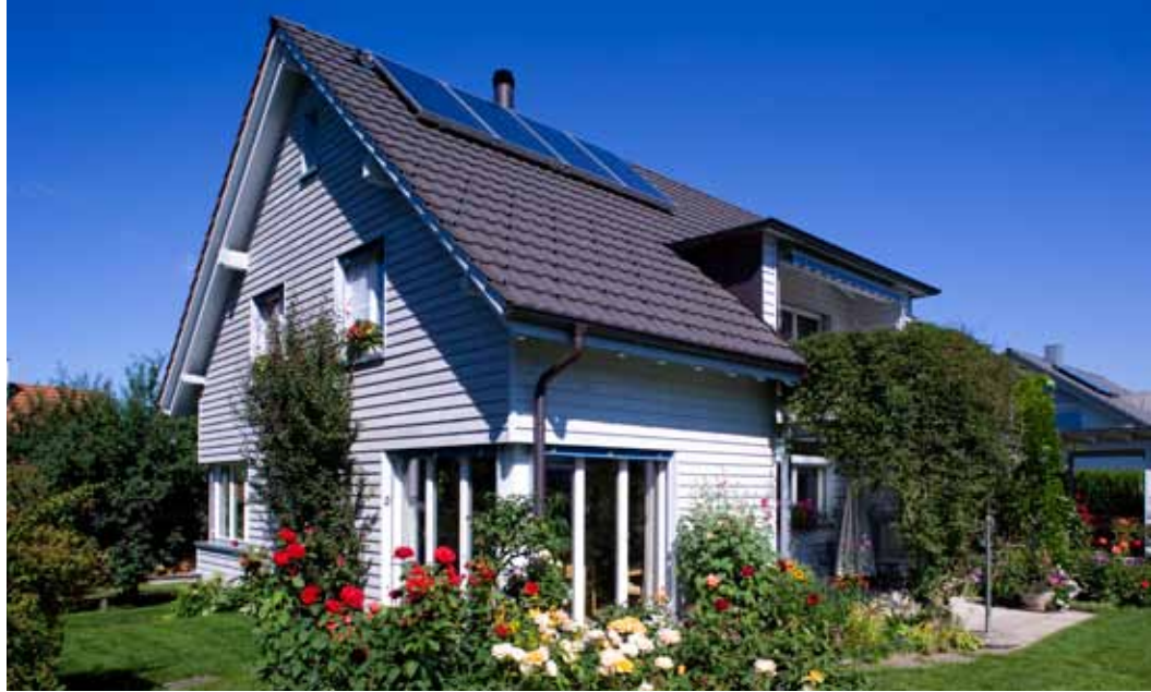
Aussenwände in Lignotrend, aussen isoliert mit Holzweichfaserplatten, Stülpschalung. Das Dach ist mit Isofloc isoliert.