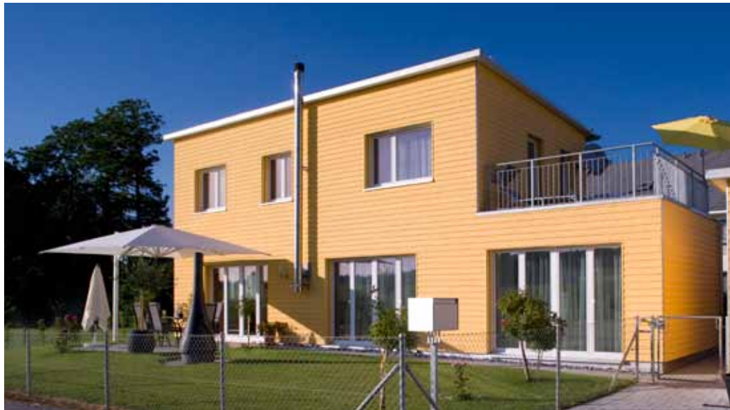
Vom Rohbau bis zum Einzug in nur 2 Monaten: Aussenwände mit 200 mm breitem LIGNO Upsi-Ständer, 25 mm Holzfaserverplatte, Zwischenraum mit Isofloc ausgeblasen, Stülpschalung.

beraten Sie in allen Fragen rund ums Bauen. Fachkundige und motivierte Mitarbeiter und ein innovativer Maschinenpark sowie unser über 20-jähriges Know-how lassen Ihr Haus zu einem Wohlfühlhaus werden.