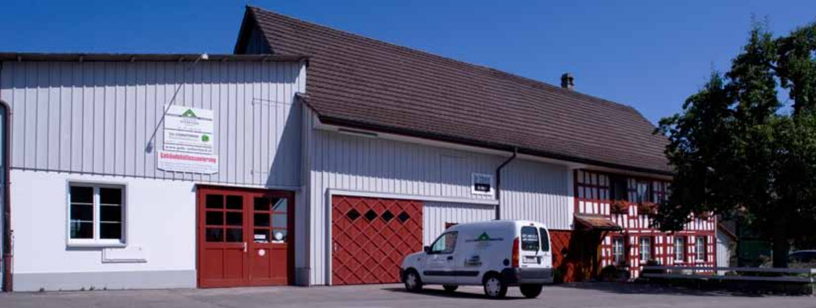
Werksgelände in Altnau