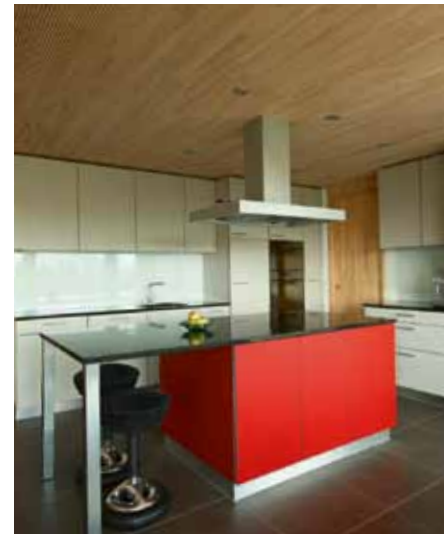
Kosten Sie es voll aus. Das messbar vorteilhafte Raumklima im Klimaholzhaus trägt dazu bei, dass es Ihnen dauerhaft so gut geht wie Ihrem Haus

Das Klimaholzhaus ist ein Haus fürs Leben. Für Ihres - und überhaupt.