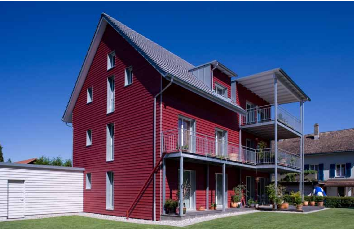
Trotz kleinem Grundstück können hier drei Familien in grosszügig bemessenen Wohnungen leben – inklusive Balkon, Autounterständen und Abstellplatz mit Geräteschopf.